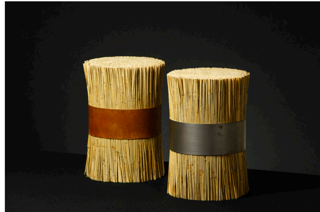
Arriba izquierda Plants . Better Future Factory