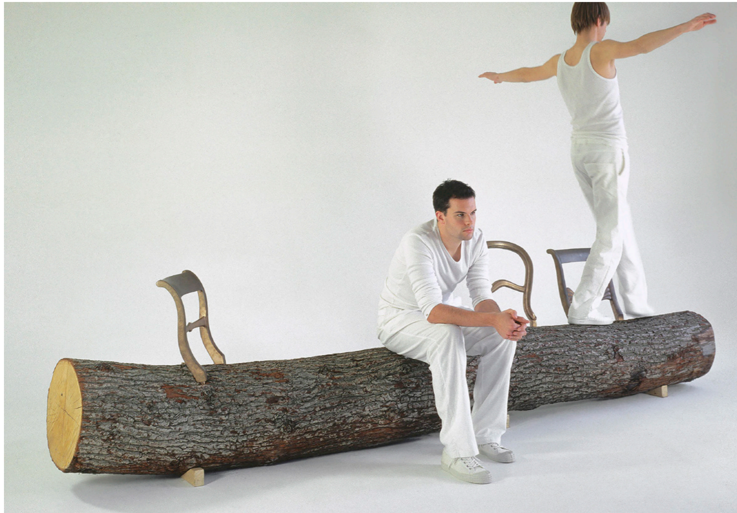
Arriba Tree Trunk Bench . Jurgen Bey. Droog

“TOMA EL TALENTO Y HAZLO DIALOGAR CON LA COMPLEJIDAD”. JURGEN BEY