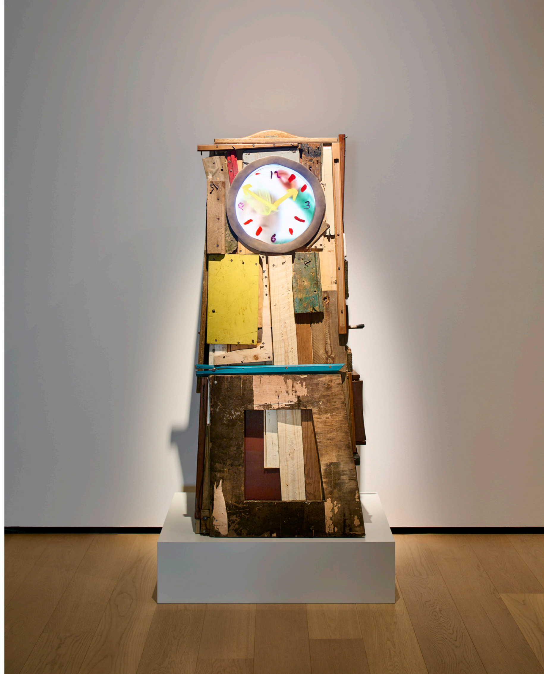
Siguiente página Grandfather Clock The Son . Maarten Baas It's About Time Exposición. Museo Voorlinden