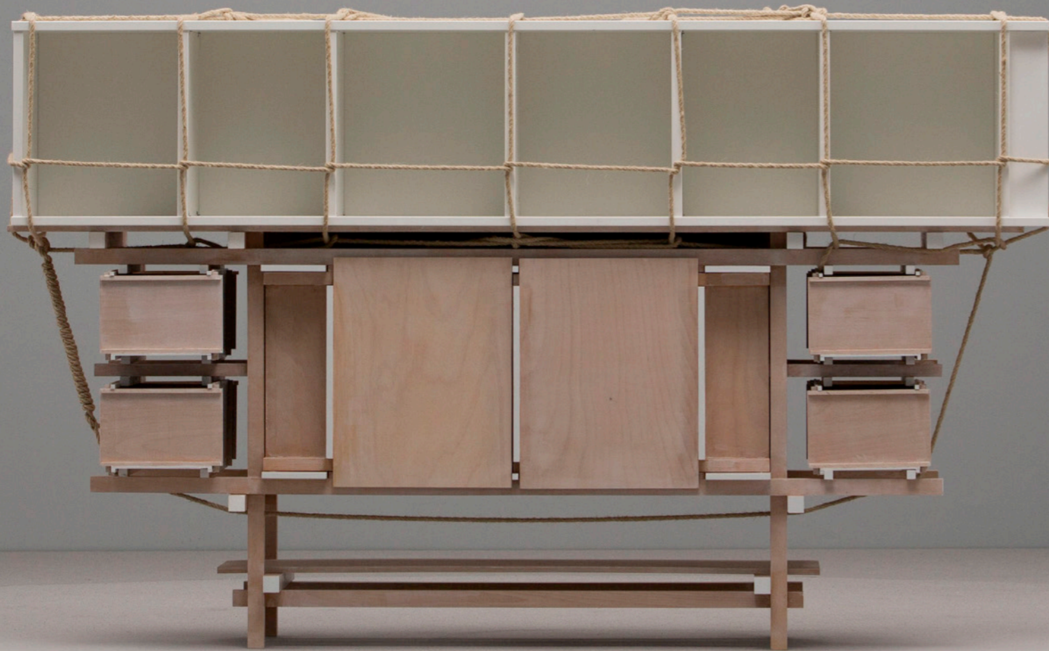
Let's Stick Together. Lucas Maassen

Lejos estamos de los años 90, cuando el diseño holandés abrió una ventana de aire fresco e irreverente y creó un ideario: la conciencia de que el pensamiento disruptivo —con un trasfondo poético— descubre caminos insospechados. Hoy, algunas de las ciudades de Países Bajos nos ofrecen un paisaje en ebullición, con pluralidad de voces consagradas y nombres emergentes tras los que se halla un concepto: diseñar el diseñar.