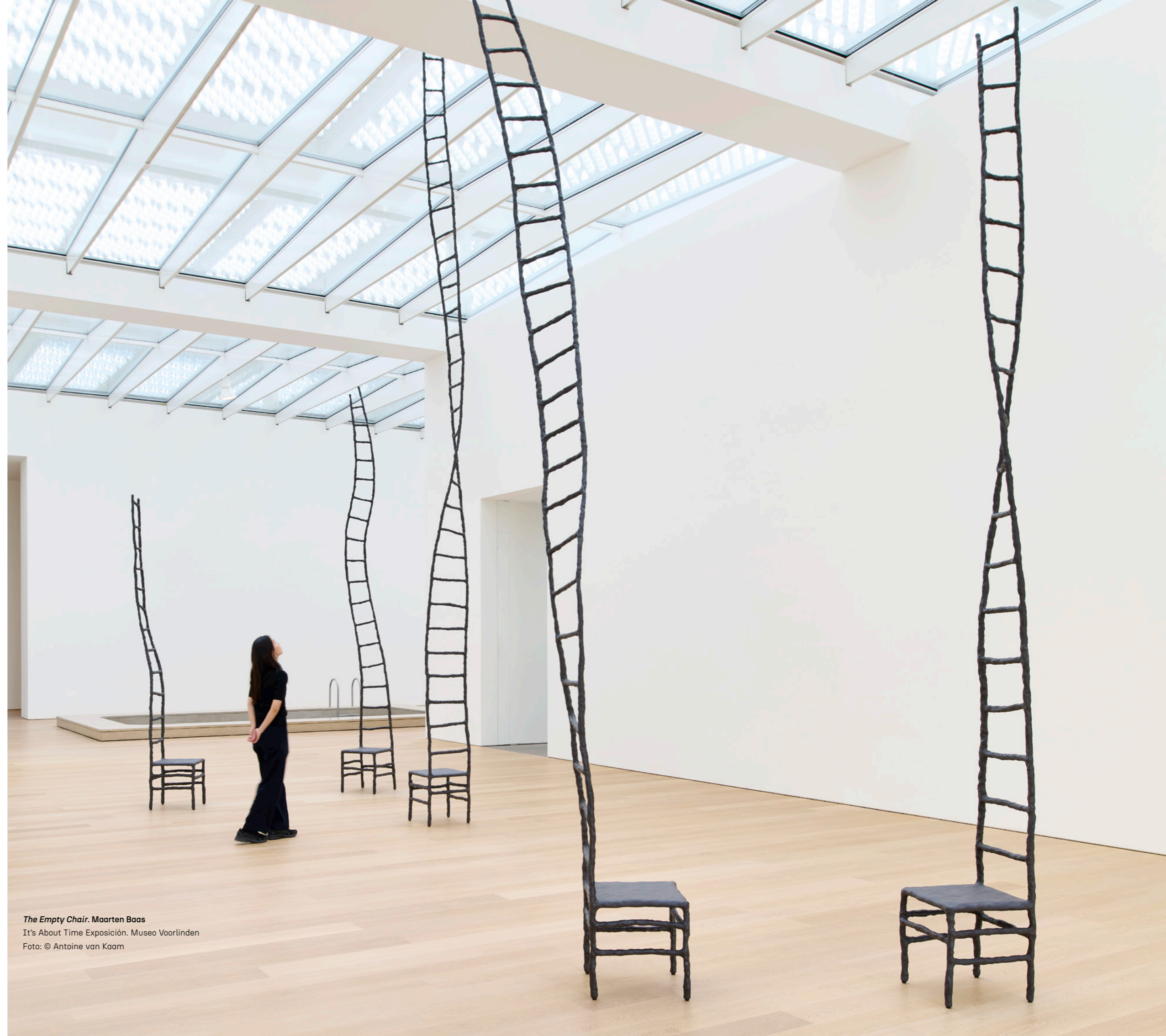
The Empty Chair. Maarten Baas It's About Time Exposición. Museo Voorlinden

Nacido de una amplitud de miras y de un nicho de oportunidades, el diseño de Países Bajos se refuerza en su autoconfianza y en la conciencia de su misión. Observación, tolerancia formal, empatía con la vida, una buena cuota de determinación y empuje colaborativo constituyen su ADN. Un diseño que, más allá de la provocación conceptual y material, es una estimulante manera de pensar y una forma de configurar la memoria del futuro. |