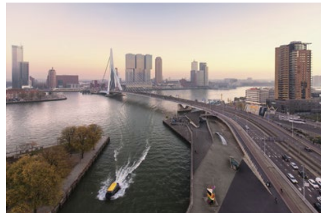
Sopra, lo skyline di Rotterdam, con una vista del ponte Erasmusbrug.

MI PIACE IL RISTORANTE DE MATROOS EN HET MEISJE, LEGATO ALLA STORIA DEL PORTO