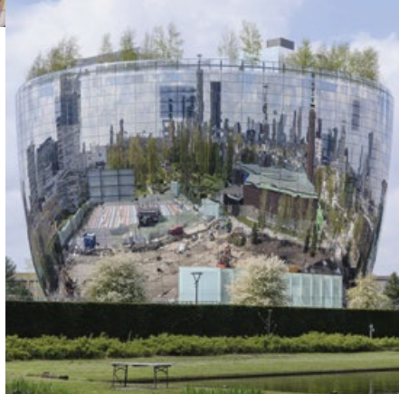
In alto, il soffitto del mercato Markthal, ideato dallo studio MVRDV, ospita "Horn of Plenty", l'opera di 11mila mq di Arno Coenen. Sopra, gli esterni del Depot, il deposito d'arte del Museum Boijmans Van Beuningen, un altro progetto di MVRDV.

proposta interessante per i vegetariani. Mi piace poi De Matroos en het meisje, ovvero "il marinaio e la ragazza", che ha una cucina tradizionale ed è legato alla storia del porto. È interessante il quartiere dove sorge, Katendrecht, prima luogo abbastanza malfamato, ora in rapido cambiamento. Qui merita una visita il Buizenpark, i nostri Kensington Gardens. E poi, da amante della birra, la Fenix Food Factory, ottimo esempio di imprenditorialità a chilometro zero: accoglie un mercato di frutta e verdura, chioschi di cibo e il birrifico artigianale Kaapse Brouwers.