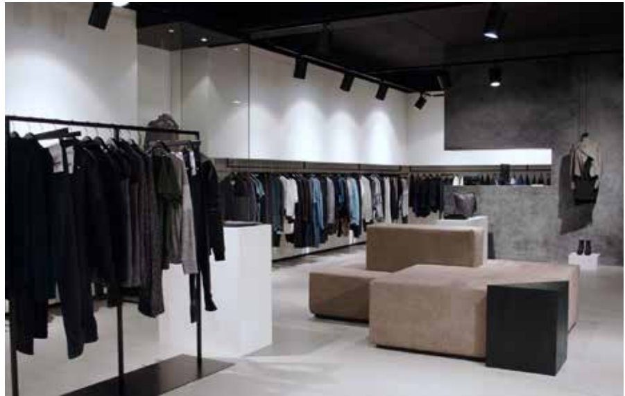
BOVEN TOONAANGEVENDE CONCEPTSTORES IN STOCKHOLM WAREN DE INSPIRATIE VOOR DEZE KLEDINGBOETIEK 'ANOTHER SHOP', ANSH46.