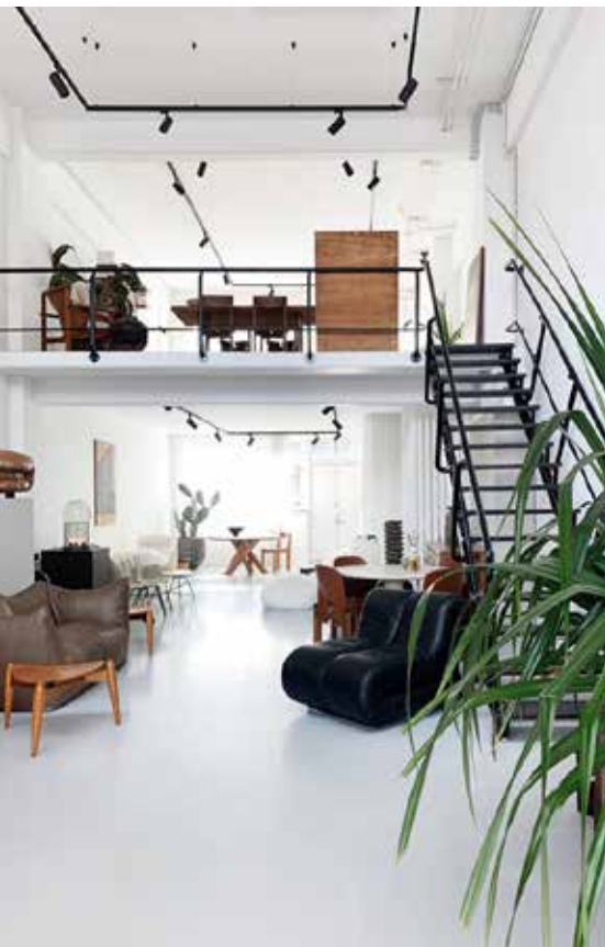
BOVEN DE NIEUWE GALERIE FUNDAMENTE TOONT BIJZONDERE INTERIEUROBJECTEN UIT DE 20STE EEUW.